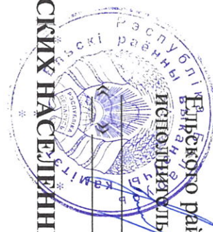
ГРАФИК СБОРА И ВЫВОЗА КОММУНАЛЬНЫХ ОТХОДОВ ИЗ СЕЛЬСКИХ НАСЕЛЕННЫХ ПУНКТОВ ЕЛЬСКОГО РАЙОНА