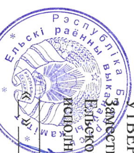
ГРАФИК СБОРА И ВЫВОЗА ВТОРИЧНЫХ МАТЕРИАЛЬНЫХ РЕСУРСОВ ИЗ ЧАСТНОГО СЕКТОРА Г.