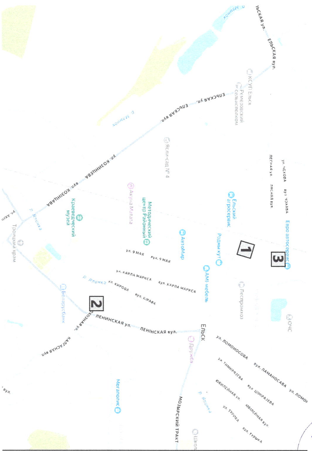
Карта-схема пунктов приема (заготовки) вторичных материальных ресурсов г. Ельск